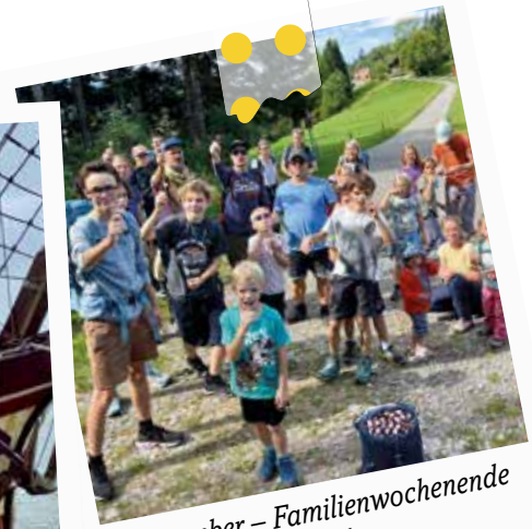
September – Familienwochenende in Amden