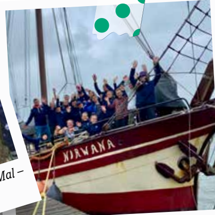
August «Ein Schiff, das sich Gemeinde nennt» – im holländischen Wattenmeer