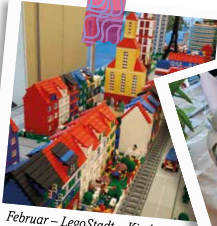
Februar – LegoStadt – Kirche leben heisst: Mitgestalten – von früh auf