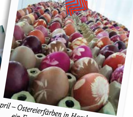
April – Ostereierfärben in Hombrechtikon – ein Familienevent mit Tradition