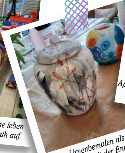
März – Urnenbemalen als Auseinander- setzung mit der Endlichkeit