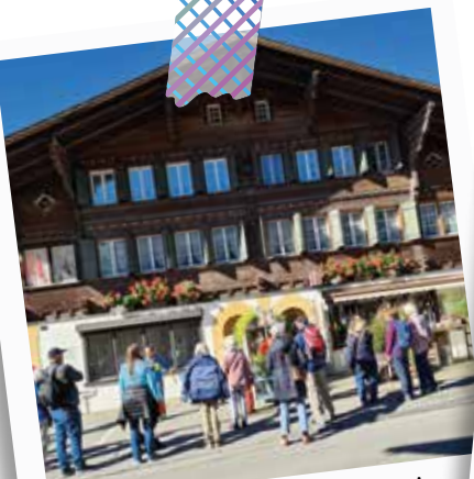
September – Senior:innen- Ferien – eine Hombrechtiker Tradition