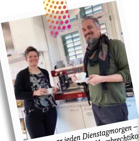
Seit Januar jeden Dienstagmorgen – Kaffee im «Bahnhöfli» Hombrechtikon