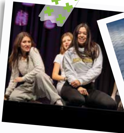
Oktober – roundabout am BounZH