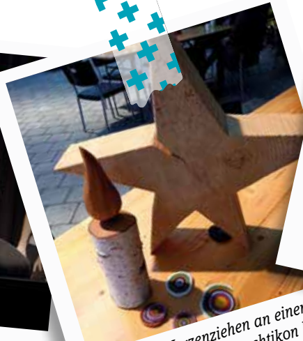
Dezember – Kerzenziehen an einem Ort, wo sich Stäfa und Hombrechtikon berühren