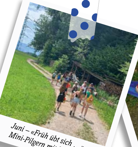
Juni – «Früh übt sich ...» Mini-Pilgern mit Kindern