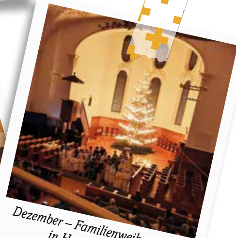
Dezember – Familienweihnachten in Hombrechtikon