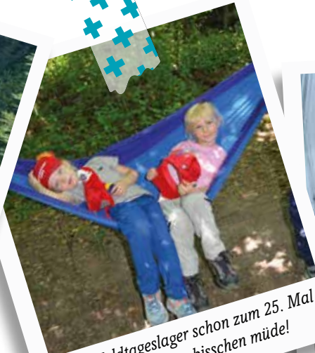
Juli – Waldtageslager schon zum 25. Mal – und noch kein bisschen müde!