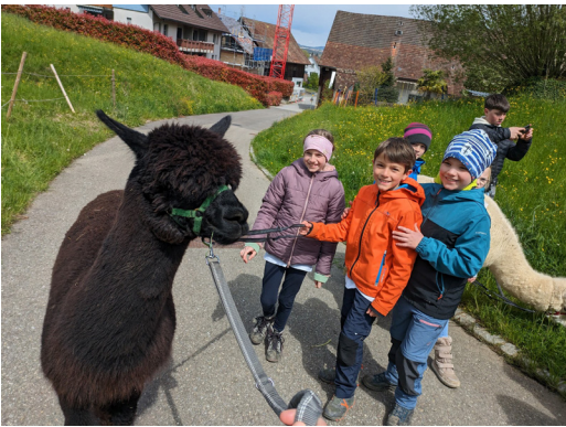
04 APRIL Das erste Unti-Tageslager für die 2- und 3.- Klässler fand statt. "unterwägs" wie zu Mose Zeiten. Hier beim Alpaka ausführen.