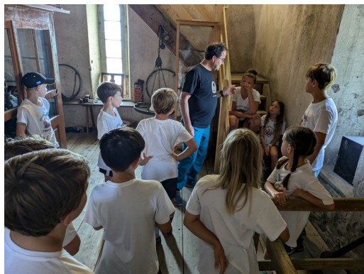
08 AUGUST Sommer-Tageslager in Stäfa mit Besteigung des Kirchturms unter kundiger Anleitung. Es gab viele Schätze zu entdecken!