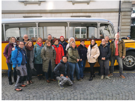
02 FEBRUAR Ein Mitarbeiterausflug ins Winterwonderland ohne Schnee, auch das können wir! Ein toller Tag mit einem tollen Team.