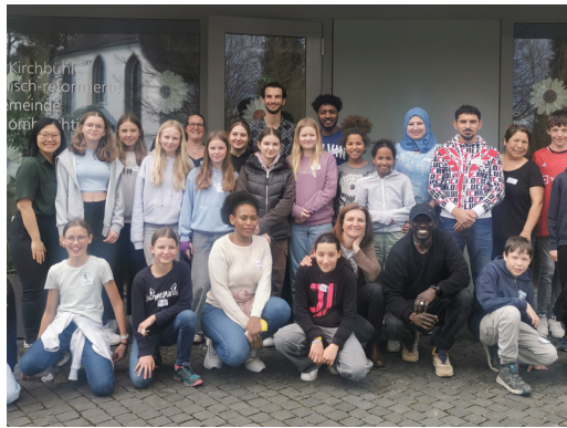
05 MAI Fremde Freunde, ein Unti-Modul mit unseren Spirit Kids und Gästen aus aller Welt. Es wurde getanzt, gekocht, gespielt und diskutiert.