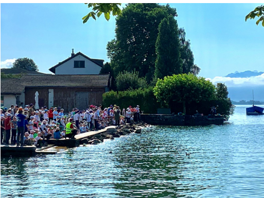
07 JULI Waldtageslager 2024, die Kinder sind voller Erwartung, ob der Wal Jona nun wieder ausspuckt am Hafen Stäfa.