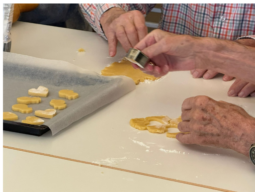
11 NOVEMBER Im Ziischtigstreff wird gesungen, gespielt und manchmal auch gebacken. Der reine Guetzlihauch weckt Erinnerungen!