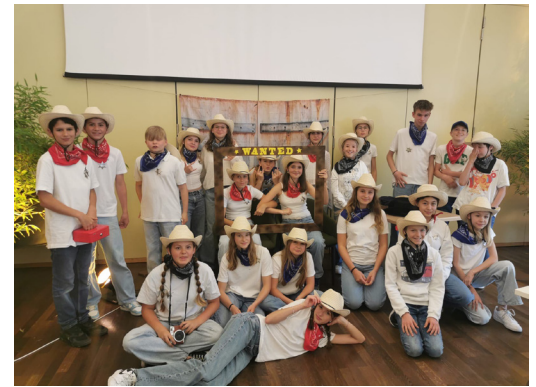
06 JUNI Relaunch des Benefiz-Dinners. Unti-Kids bewirten einen Abend lang Gäste für einen guten Zweck. Es ging in den wilden Westen!