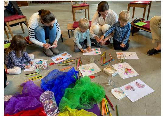
03 MÄRZ Wenn Buntstifte den Kirchenboten zieren ist es Fiire mit dä Chliine-Zeit. Ein farbig-fröhlicher Anlass.