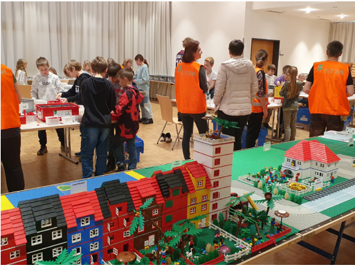
01 JANUAR Das KGH Blatten verwandelte sich in eine reisige Lego-Stadt dank unseren Unti-Kids und dem Bibellesebund.