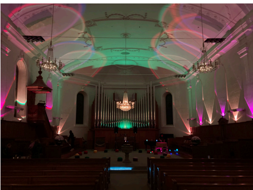
10 OKTOBER Tanz in der Kirche! Stimmiges Ambiente und cooler Sound mit tiefgründigen Gesprächen an der Teebar.