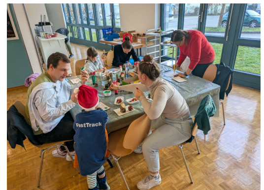
12 DEZEMBER Es glitzert bunt im Blatten. Unter fachkundiger Anleitung wird gebastelt und die adventliche Stimmung bei einem Punsch genossen.