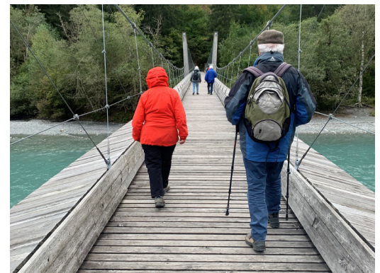
09 SEPTEMBER Seniorenferien mit einer Wanderung in der wunderschönen Schlucht in Trin Mulin.