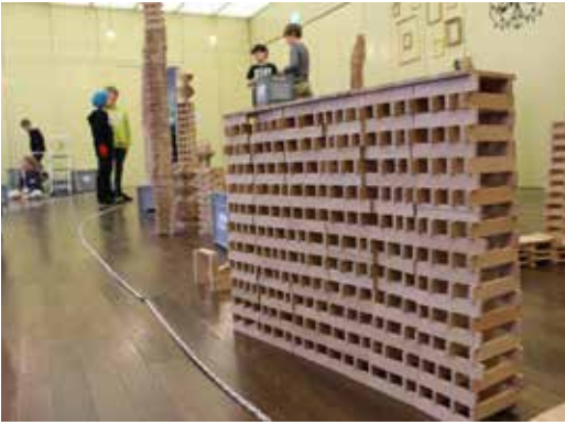
01 JANUAR HOLZBAUWELT zu Gast Unsere 4. Klässler erleben während einem Wochenende, Geschichten aus der Bibel, mit 80'000 Holzklötzchen.