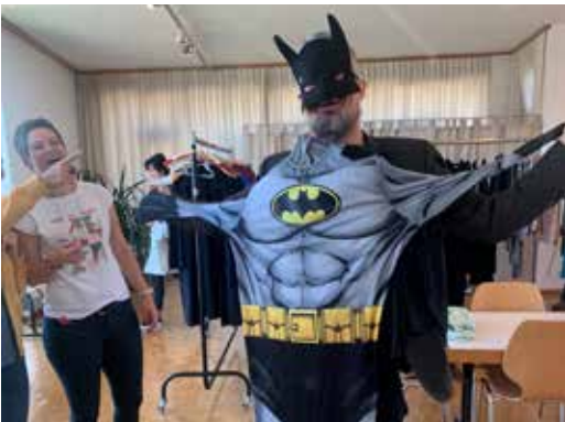
10 OKTOBER Am Kleidertausch wird nicht nur in neue Hosen, sondern auch in neue Rollen geschlüpft!