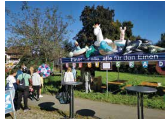
09 SEPTEMBER Süsser Boxenstopp am SlowUp! Am wohl buntesten Stand in Stäfa, verteilen Unti-Kids Fruchtgummispiesse.