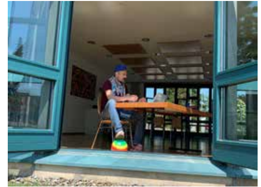
06 JUNI Zäme im Blatte! Im 2. Quartal öffnen sich jeden Mittwoch die Türen und Fenster des Zollikerzimmers um gemeinsam zu visionieren.