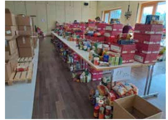
03 MÄRZ Bei der Aktion «2x Weihnachten» verteilen Freiwillige der Kirchgemeinde gut 3 Tonnen Lebensmittel im Dorf.