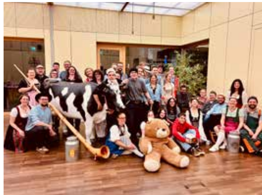
11 NOVEMBER Grosses Danke an alle Freiwilligen im Jugendbereich zum Motto «Chum uf d'Alp».