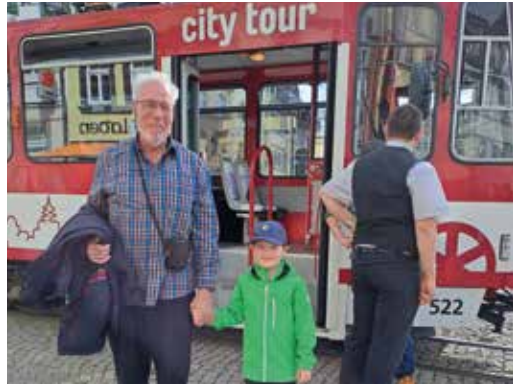
05 MAI In der Gemeindeferienwoche in Erfurt entdeckten wir Kultur und Geschichte Mittel- deutschlands.