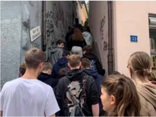
04 APRIL Im Konf-Weekend entdecken wir Baden und erklimmen die Treppen hinauf zur Schloss-Ruine.