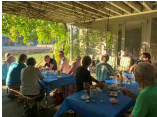
08 AUGUST Die Crew der Aufbauwoche trifft sich zum gemütlichen Zvieri und lässt die erlebnis- reiche Woche «revue passieren»