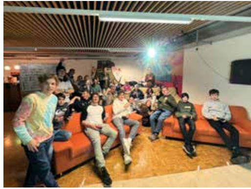
02 FEBRUAR Grosses Mario Kart-Turnier auf der Nintendo Switch mit Siegerehrung im Jugendraum im KGH Blatten!