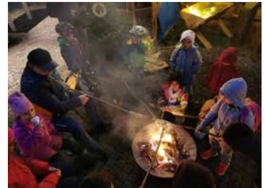
12 DEZEMBER An der adventlichen Dorf- mitte werden weihnachtliche Nachmittage gemütlich am Feuer ausgeklungen.