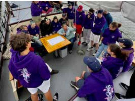
07 JULI Bei Wind, Sonne und einer tollen Segel- crew gemeinsam auf dem Wattenmeer in Holland unterwegs.